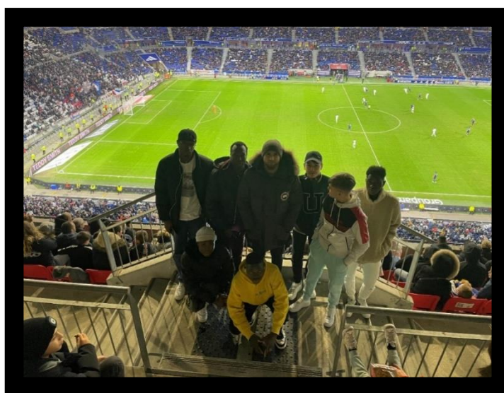
SAS MNA Rapport d'activité 2022