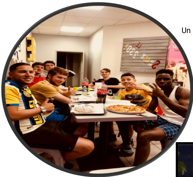
Un repas collectif à Saint-Genis-Laval.